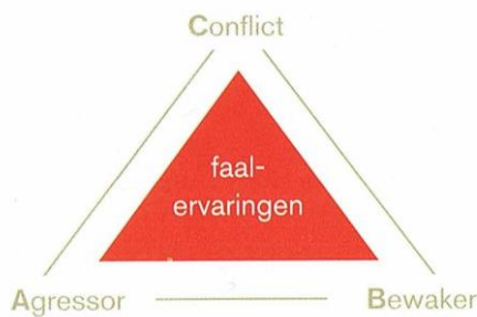
Figuur 2: Faalervaringendriehoek

Veel bewoners hebben in hun leven faalervaringen opgedaan waarbij begeleiding (in de ruimste zin van het woord) de rol van bewaker heeft gespeeld, de bewoner de rol van agressor (veroorzaker van problemen) kreeg en er steeds conflicten waren.