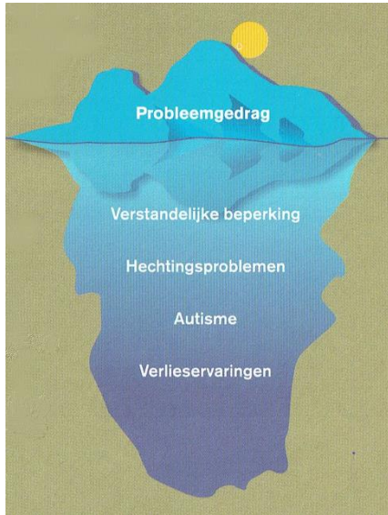
Figuur 1: Ijsberg model van probleemgedrag

Locatie Landlust biedt ondersteuning aan mensen met een licht en matige verstandelijke beperking waarbij sprake kan zijn van bijkomende problematiek, namelijk autisme, psychiatrische problematiek, hechtingsproblematiek en agressie. Deze bijkomende problemen kunnen probleemgedrag veroorzaken. Binnen het Landlust gaan we daarbij uit van het ijsbergmodel, waarbij dit probleemgedrag wat aan de oppervlakte te zien is veroorzaakt wordt door dieperliggende problematiek.