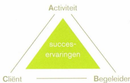
Figuur 3: Succeservaringendriehoek

Binnen het Landlust is de insteek om door het opdoen van succeservaringen tijdens het doen van activiteiten (die passen bij de fase waarin de bewoner verkeerd) de bewoner te laten groeien in zelfstandigheid en zelfvertrouwen. De begeleiding sluit nauw aan bij de directe leefwereld van de cliënt, is laagdrempelig en passend aanwezig, eventueel met ondersteuning van een dagprogramma.