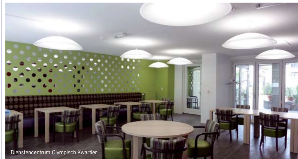
Dienstencentrum Olympisch Kwartier

Eind september 2009 is in een nieuwbouwcomplex aan de Amstelveenseweg een nieuwe Cordaan-locatie in gebruik genomen. Het gaat hier niet om een woon- of dagbestedingslocatie, maar om een dienstencentrum.